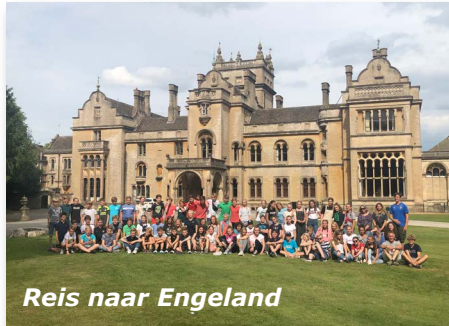
Reis naar Engeland

Is zo'n speciaal certificaat iets voor jou?