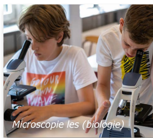
Microscopie les (biologie)

Als je als havoleerling op het KWC komt, start je in een kansklas Hv. De eerste weken krijg je alle vakken op havoniveau, daarna kijken we of je wellicht voor vakken wat moeilijkere stof aankan, want we willen wel dat je uitgedaagd blijft. Je volgt dan voor zo'n vak, in je eigen klas, de vwo-stof en krijg je zelfs vwo-cijfers. Uiteindelijk kun je na 2 jaar versneld examen doen in zo'n vak of zelfs helemaal overstappen naar het vwo. Maar uitgedaagd blijven is het belangrijkste doel!