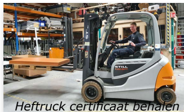
Heftruck certificaat behalen

Wij weten het zeker: jij bent ergens goed in! Waar je goed in bent, daar kun je echt voor gaan. Daarom is leren leuk in het praktijkonderwijs!