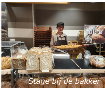
Stage bij de bakker