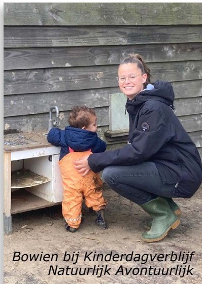
Bowien bij Kinderdagverblijf Natuurlijk Avontuurlijk