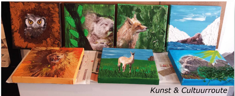
Kunst & Cultuurroute