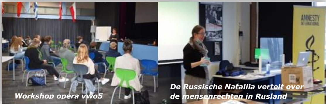
Workshop opera vwo5